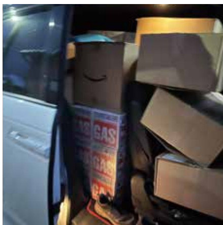
支援物資を届けてもらう