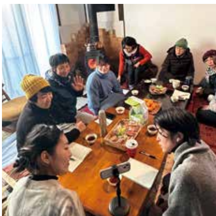
支援グループのミーティング風景