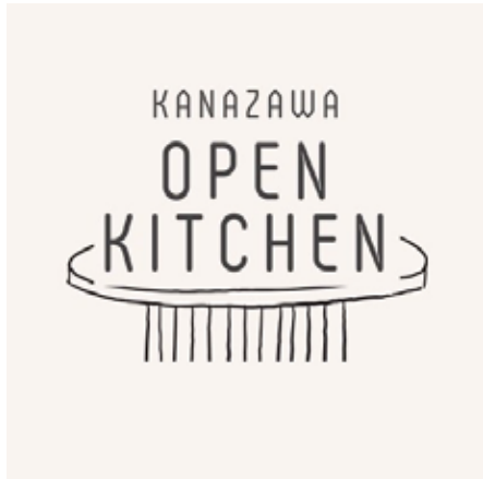
炊き出しグループ 「KANAZAWA OPEN KITCHEN」立ち上げ