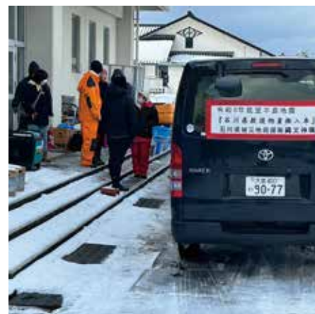
支援物資 避難所 (珠洲市／緑ヶ丘中学校)