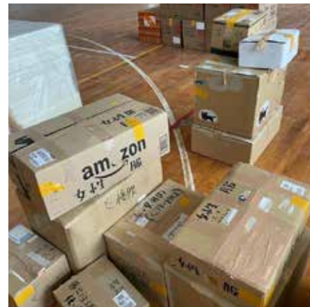
支援物資 避難所 (珠洲市／飯田高校)