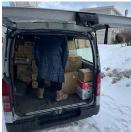
支援物資 避難所 (珠洲市／飯田高校)