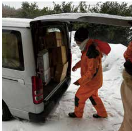
支援物資 避難所 (珠洲市／飯田高校)