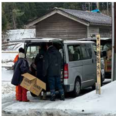
支援物資 民間避難所 (珠洲市)