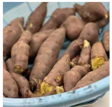
炊き出し風景（蒸かし芋）