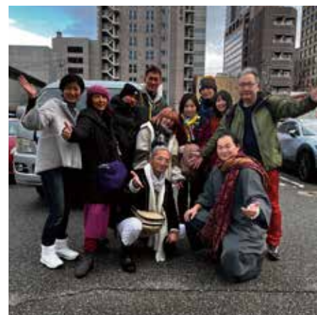
支援物資を届けます