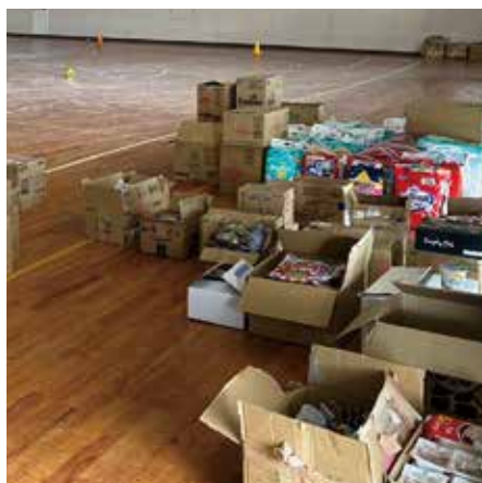
支援物資 避難所 (珠洲市／飯田高校)