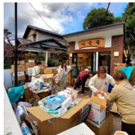
支援物資の仕分け作業