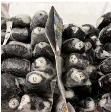
炊き出し風景（おにぎり）