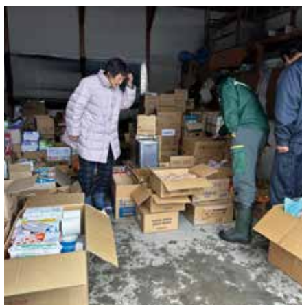
支援物資 民間避難所 (珠洲市)