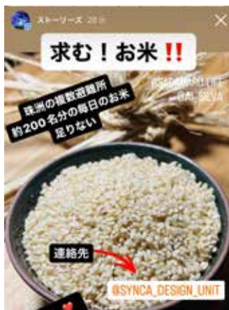
支援物資募集の情報拡散